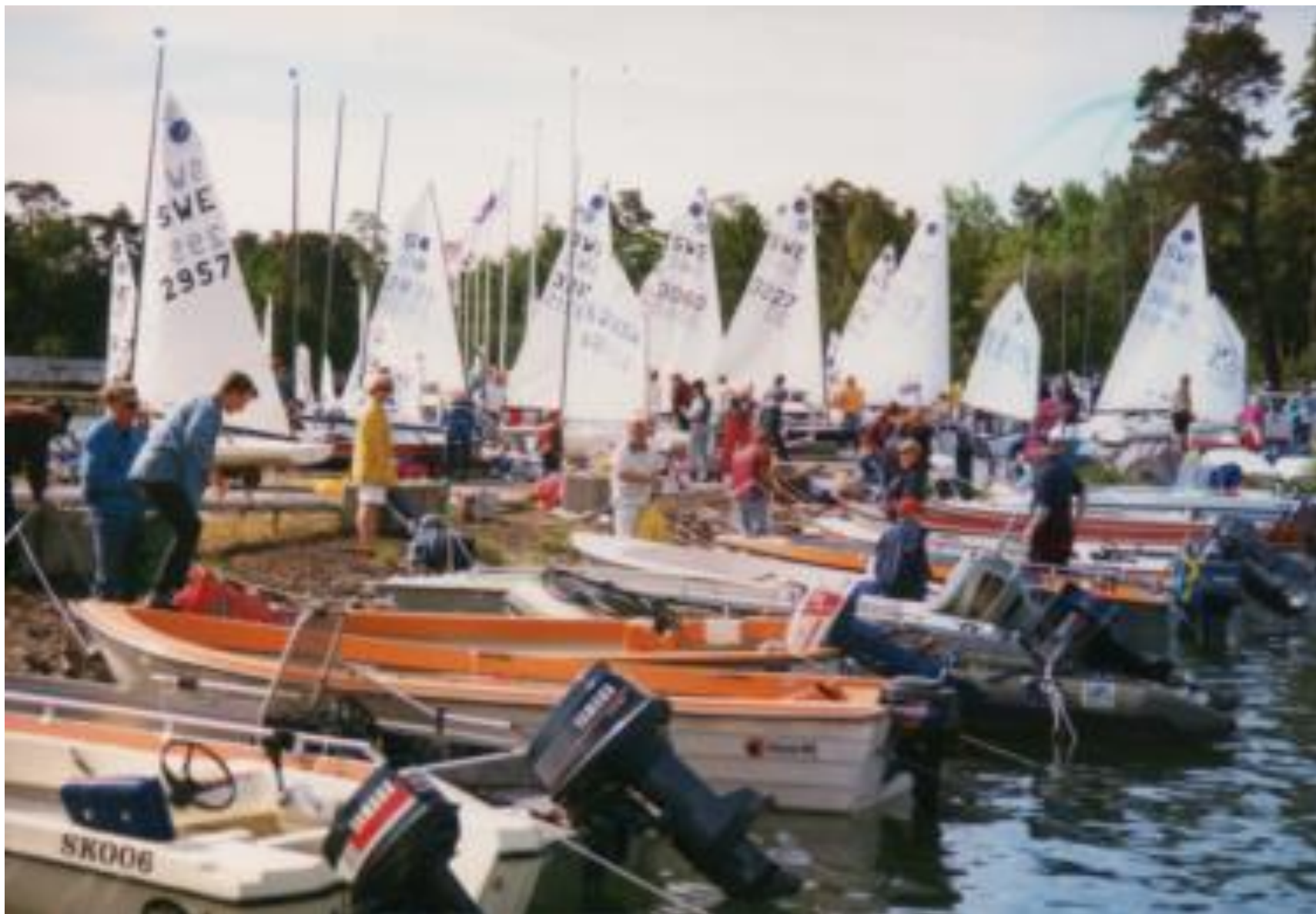
Jollekval år 1997