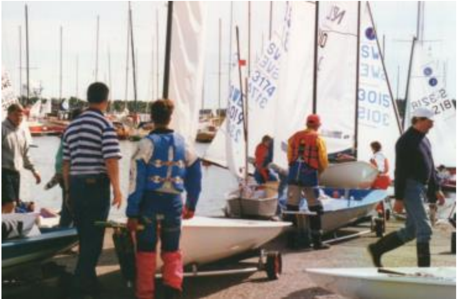
Jollekval år 1997