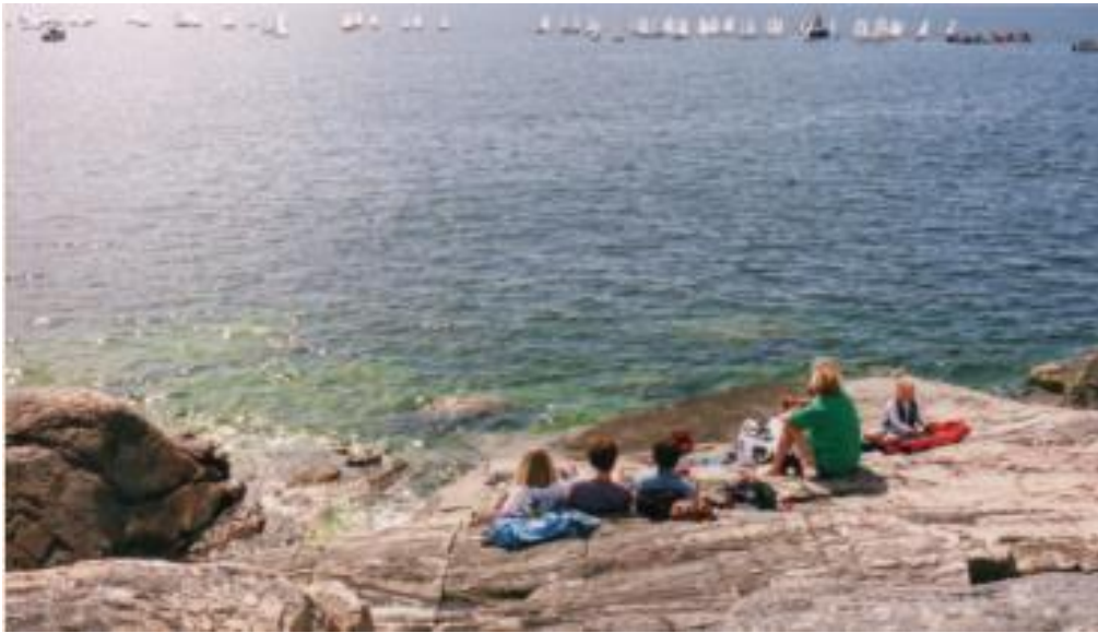
OP-start vid Femöre huvud