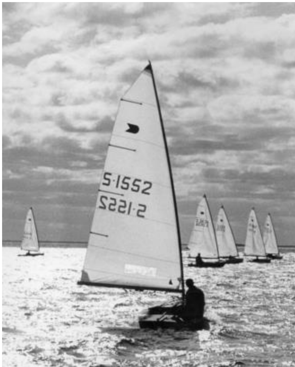
OK-jollesegling på 70-talet