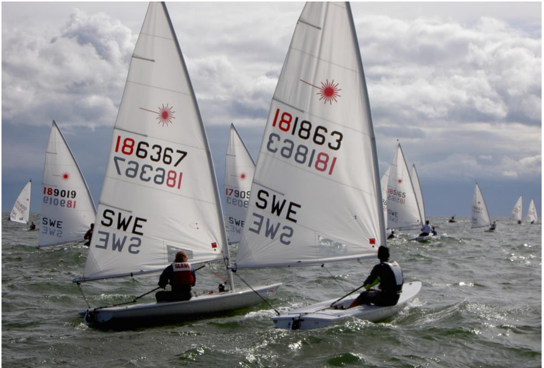
GP-segling i Laser