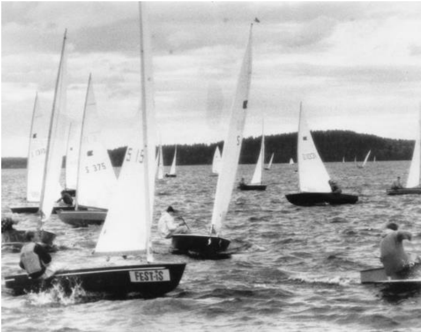
VM-kval i OK-jolle på -70 talet