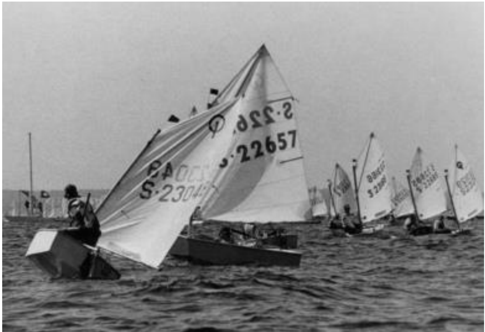
OP-seglare inför start 1992