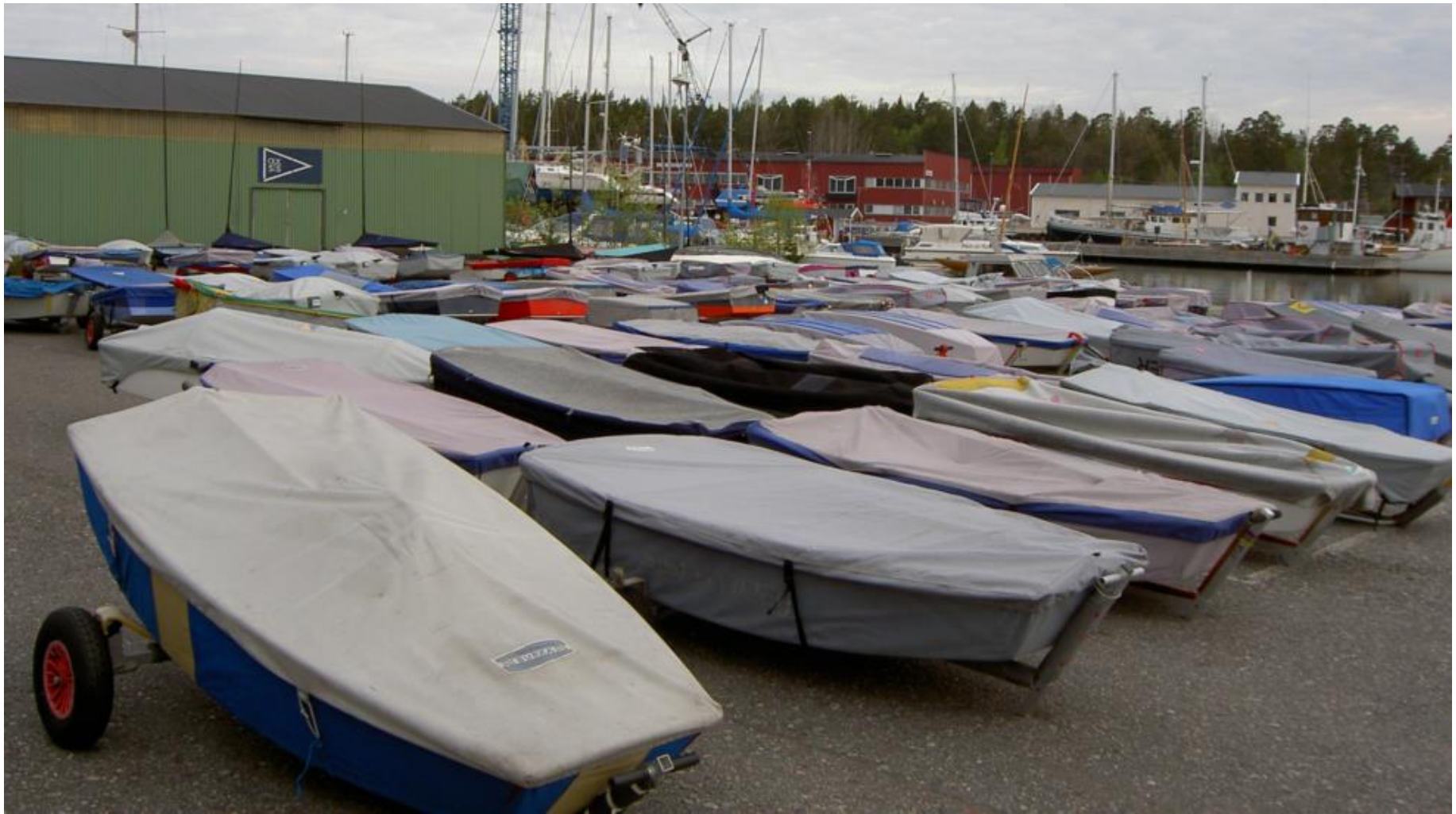
Optimister vid en kvalsejling