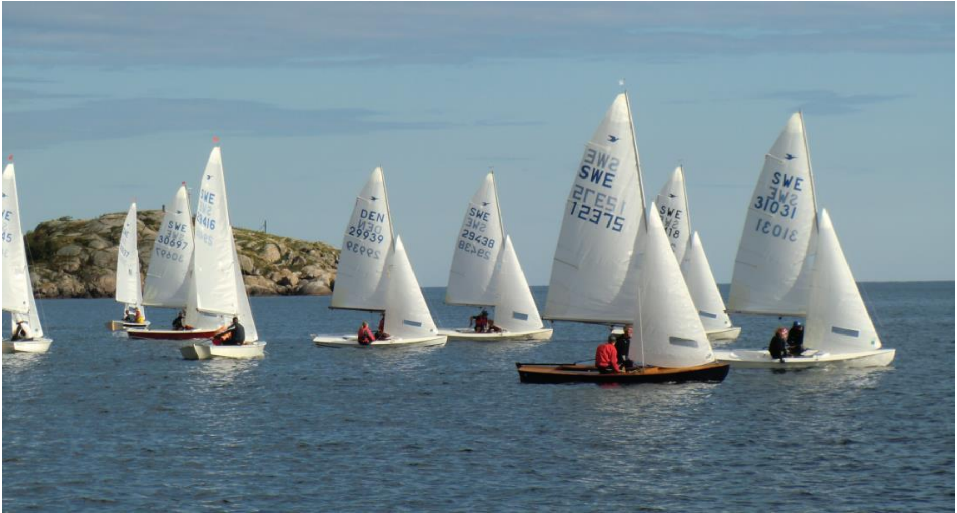
Snipe SM 2013